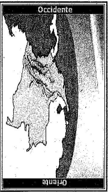
Posición actual aproximada del Sol respecto a Colombia

De acuerdo con lo establecido en el numeral 14 del artículo 6 del Decreto número 4175 de 2011, el Instituto Nacional de Metrología ordena, coordina y difunde la hora legal de la República de Colombia: