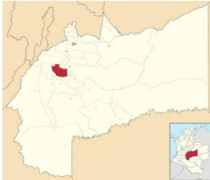
Ilustración 1. Ubicación Geográfica municipio El Castillo, Departamento del Meta.