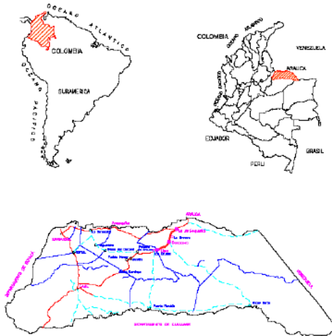
Ilustración 1. Ubicación Geográfica, Departamento de Arauca.