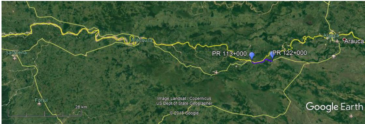
Ilustración 3. Localización del tramo a intervenir La Yuca - La Antioqueña, Departamento de Arauca.