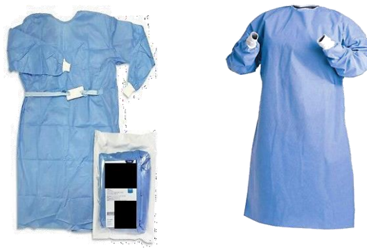
Ilustración del producto

Estas imágenes son indicativas y se incluyen con el propósito de ilustrar el producto requerido. De ninguna manera corresponde a unas especificaciones precisas.