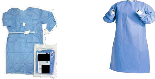
Ilustración del producto

Estas imágenes son indicativas y se incluyen con el propósito de ilustrar el producto requerido. De ninguna manera corresponde a unas especificaciones precisas.