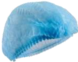
ILUSTRACIÓN DEL PRODUCTO