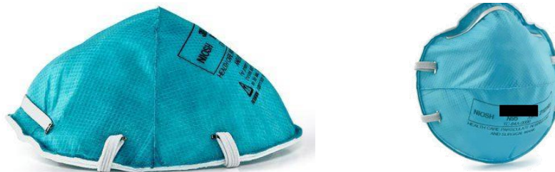
Ilustración del producto.