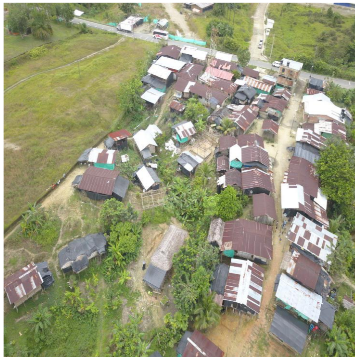
Ilustración 1 Localización general del Proyecto-Fuente Propia